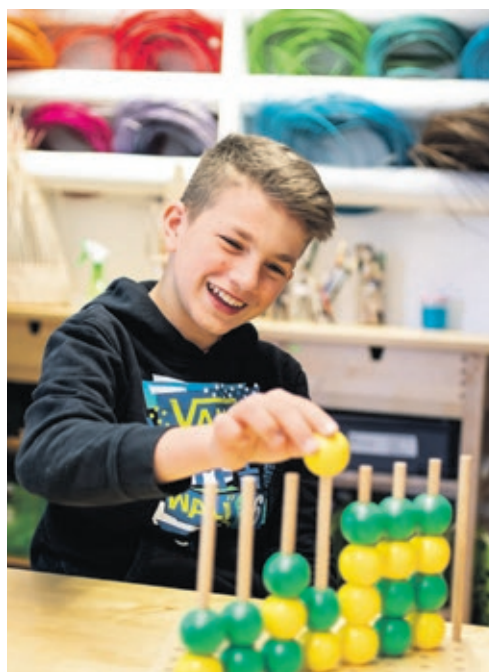
Ergotherapie zählt immer noch als absolute Frauendomäne. Nicht so am Boys' Day.

ausmachen. Trotzdem wählen mehr als die Hälfte der Mädchen aus nur zehn verschiedenen Ausbildungsberufen im dualen System – kein einziger naturwissenschaftlich-technischer ist darunter. In Studiengängen wie beispielsweise Ingenieurwissenschaften oder Informatik bleiben Frauen weiterhin deutlich unterrepräsentiert. Damit schöpfen sie ihre Berufsmöglichkeiten nicht voll aus – den Betrieben aber fehlt gerade in technischen und techniknahen Bereichen zunehmend qualifizierter Nachwuchs. Am Girls' Day erleben die Teilnehmerinnen in Laboren, Büros und Werk-