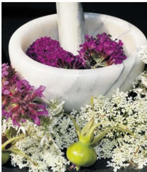
Auch Heilpflanzen und Kräuter kommen bei der Kneipp-Kur oftmals in Form einer Pflanzentherapie zum Einsatz.

Einen weiteren Bestandteil der Kneipp-Kur stellt der Kneipp-Guss dar, etwa mit kaltem Wasser über die Knie. Nach dem Duschen soll ein Knieguss zum Beispiel präventiv gegen geschwollene Beine wirken. Ein Armguss kühlt zudem nicht nur an heißen Sommertagen merklich ab, sondern hilft auch bei Durchblutungsstörungen sowie bei Herz- und Lungenbeschwerden. Ebenso kann ein Gesichtsguss mit kühlem oder sogar richtig kaltem Wasser bei Kopfschmerzen Wunder wirken – ein frischer Teint und der „Wach“-Effekt inklusive. Darüber hinaus gehört