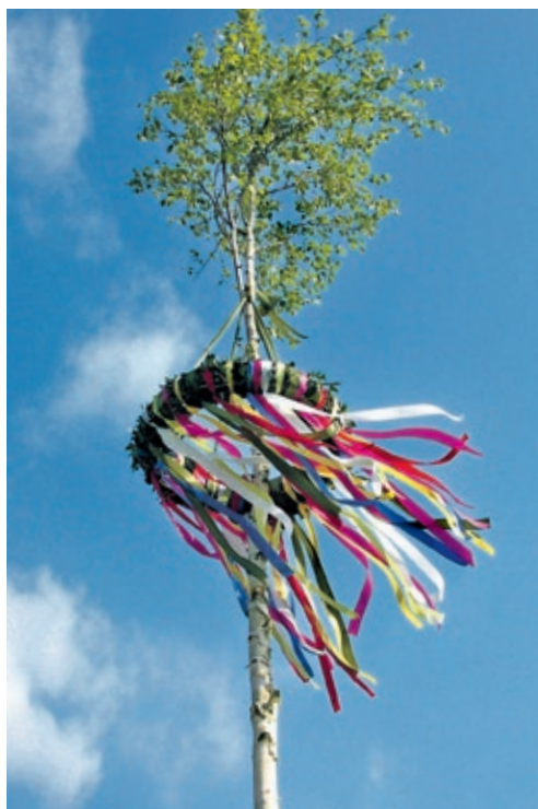
Im 16. Jahrhundert entwickelte sich der Brauch, einen geschmückten Baum zum 1. Mai aufzustellen.

Schon unzählige Dichter haben den „Wonnemonat“ Mai gepriesen. Kein Wunder, denn die Natur gibt jetzt alles: Birke und Maiglöckchen blühen in ganzer Pracht, Waldmeister und Sauerampfer stehen ebenfalls im Saft. Zudem begleiten kaum einen anderen Monat so viele Feste und Bräuche – je nach Region existieren dabei ganz unterschiedliche Traditionen. Als bekannteste gilt wohl die Walpurgisnacht in der Nacht zum 1. Mai. Doch woher kommt dieser Brauch überhaupt? Ursprünglich stammt er von heidnischen Frühjahrsbräuchen ab, bei denen die Germanen den Beginn des Frühlings feierten. Ein großes Fest mit Essen, Trinken und Tänzen sollte dabei die bösen Geister des Winters vertreiben.