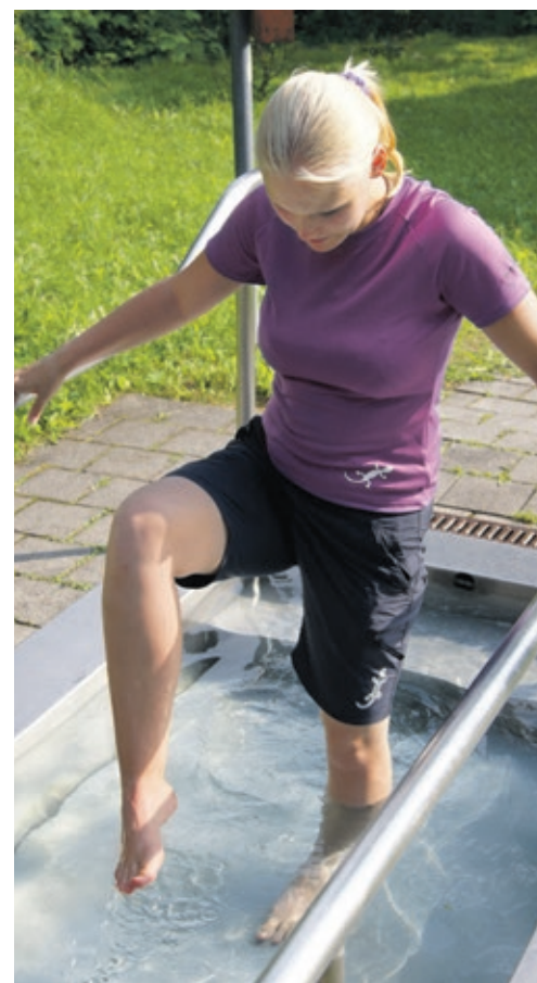
Das Treten im kalten Wasser wirkt nachweislich gesundheitsförderlich.