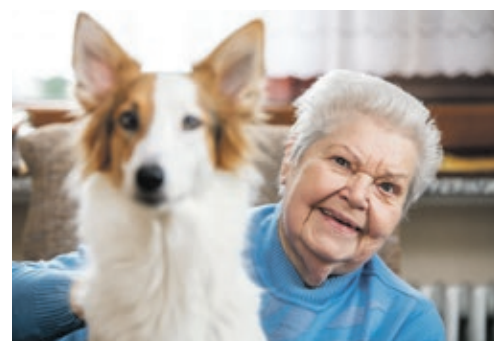
Niedliche Begleiter auf vier Pfoten sorgen für Spaß und Freude.

oder „Seniorentanz“ an. Solche und viele weitere Angebote werden von der hiesigen Bevölkerung gerne angenommen.