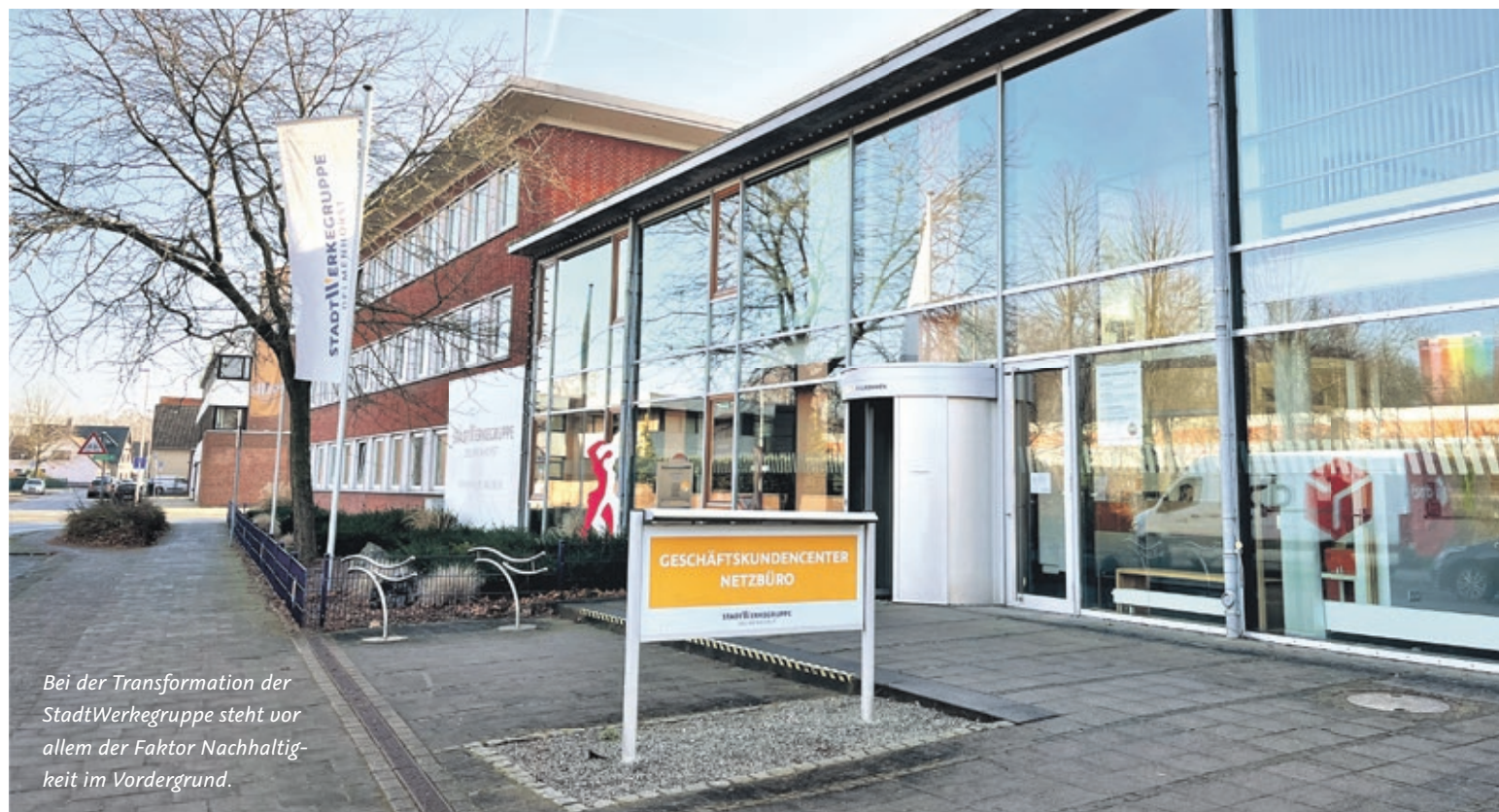
Bei der Transformation der StadtWerkegruppe steht vor allem der Faktor Nachhaltigkeit im Vordergrund.