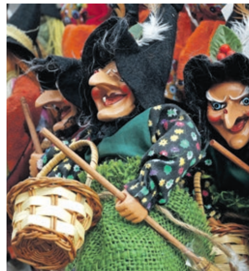
Vor allem auf den Walpurgisfeiern rund um den Brocken sieht man kleine und große Hexen allerorts.

Viele der modernen Bräuche gehen auf andere Traditionen zurück, die nicht unbedingt in direktem Zusammenhang mit der Hexennacht stehen. Dazu zählen unter anderem Frühjahrsbräuche, wie das Aufstellen von Maibäumen oder das Maisingen, bei dem Kinder um die Häuser ziehen und um Süßigkeiten bitten. Zu den beliebtesten modernen Bräuchen gehört jedoch nach wie vor der Tanz in den Mai. Im Harz finden dabei noch heute die in Deutschland größten öffentlichen Feiern rund um die Walpurgisnacht statt, zu denen die Veranstalter jedes Jahr Zehntausende von Besuchern erwarten.