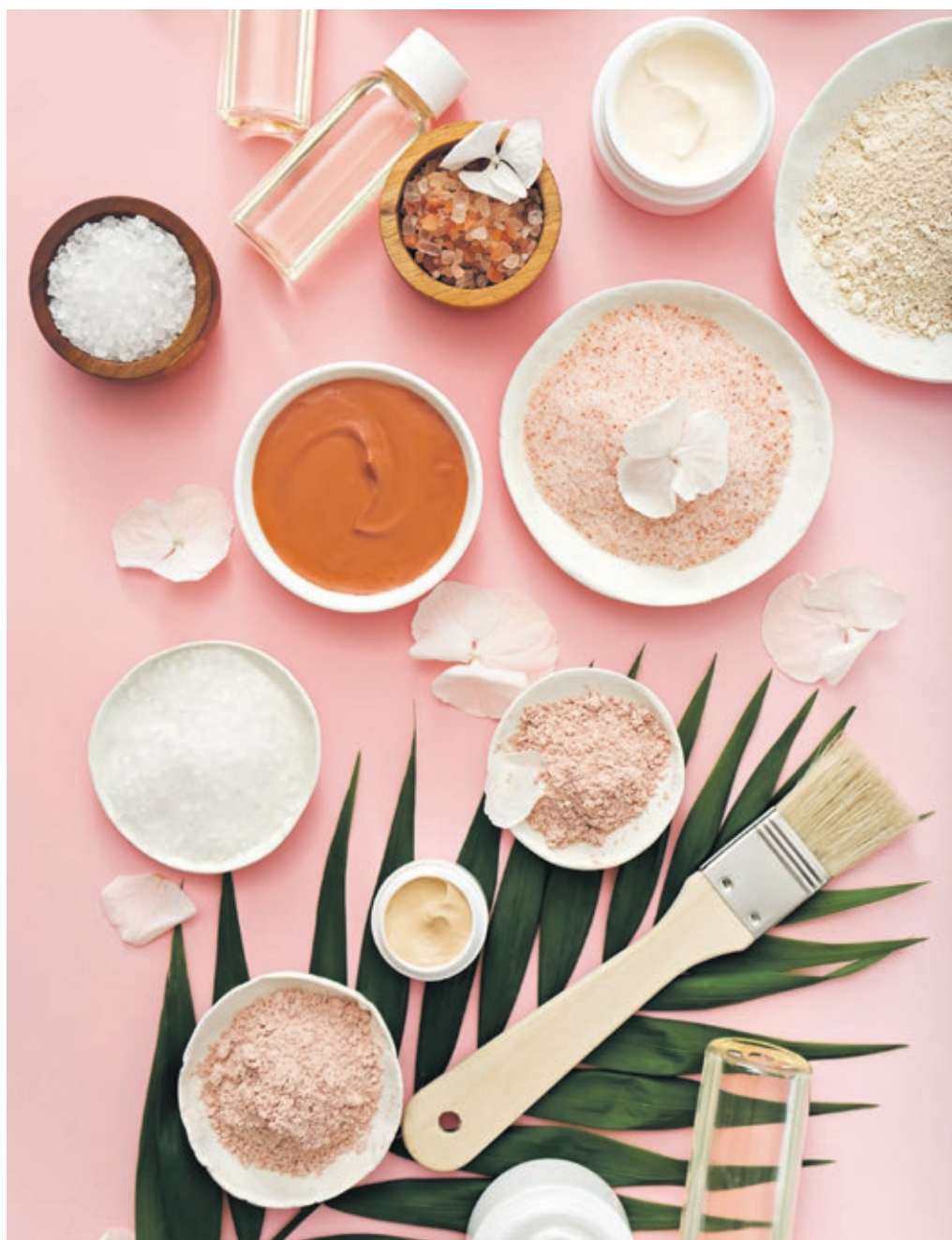
Angepasst an die individuellen Bedürfnisse: Kosmetik lässt sich mit wenig Aufwand selbst herstellen.

Schon seit Jahren hält sich die Tendenz, seine Kosmetik selbst zu produzieren: Zahllose Ratgeber, Blogs und Videoanleitungen informieren über hausgemachte Schönheitsartikel. Neuen Aufschwung erhält der Trend seit einigen Monaten dank der Ergänzung zweier Worte: „Zero Waste“. Denn mit den selbst gemachten Kosmetika vermeiden Verbraucher gleichzeitig den Plastikmüll der gängigen Drogerieartikel. Badebomben, Körperbutter, Gesichtscreme und Co. lassen sich dabei mit nur wenigen Handgriffen kinderleicht selber herstellen. Wichtiger Vorteil hierbei: Die selbst gemachten Produkte lassen sich an die speziellen Ansprüche der Haut an-