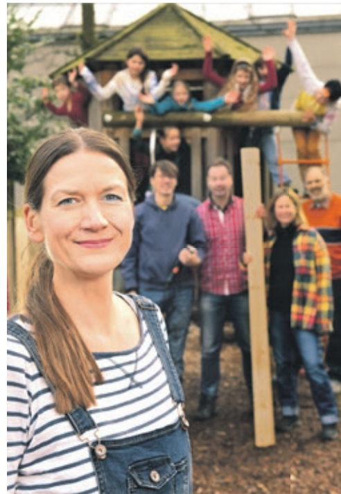
Gemeinnützige Projekte erfahren durch Crowdfunding Aufmerksamkeit und finanzielle Unterstützung.

Wer also eine tolle Idee für die Region hat, aber leider nicht genug Kapital, geht einfach auf die Plattform und beschreibt das geplante Projekt. Es können auch Fotos und gegebenenfalls ein Video hochgeladen werden, um das Projekt vorzustellen. Und dann geht es richtig los: In der zweiwöchigen Startphase muss der Ideengeber kräftig die Werbetrommel rühren und Freunde, Familie oder Kollegen begeistern. Die Anzahl der „Fans“ steht in Abhängigkeit mit der Finanzierungssumme des Projektes: Wer beispielsweise bis 500 Euro benötigt, muss auf mindestens 10 Fans kommen. 20 Fans sind bei einem Betrag von bis zu 1.000 Euro nötig. Kommen genügend Fans zusammen, wird das Projekt drei Monate lang für die Finanzierungsphase freigeschaltet. In dieser Zeit können sich alle Unterstützer mit einem fi-