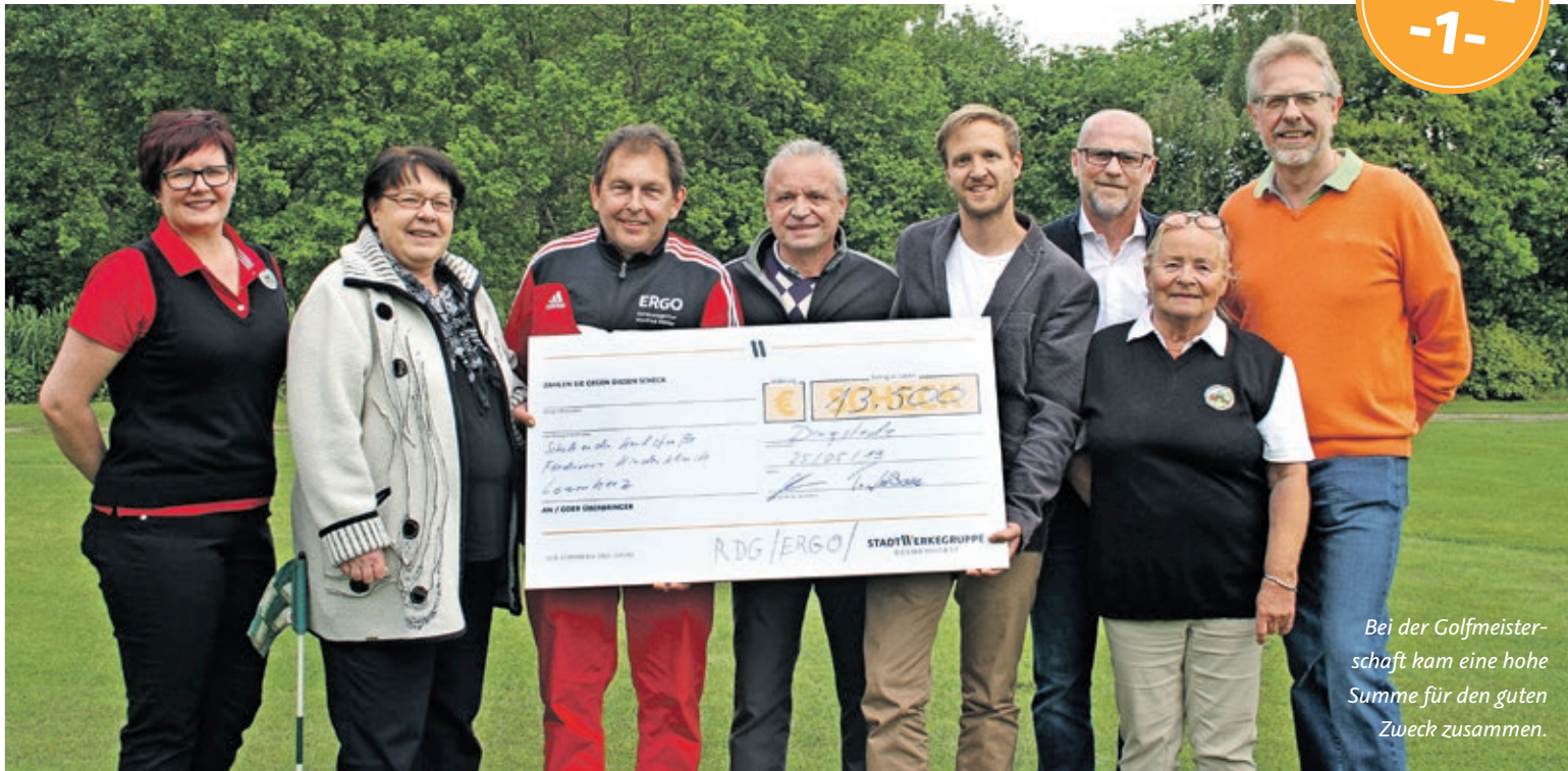
Bei der Golfmeisterschaft kam eine hohe Summe für den guten Zweck zusammen.