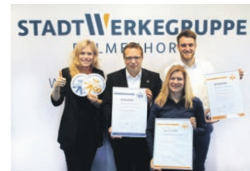
Wir sind TOP-Lokalversorger 2019 – Mitarbeiter der StadtWerkegruppe Delmenhorst freuen sich über diese Auszeichnung.

Es stinkt vielen Delmenhorstern. Die Schuldige ist in den sozialen Netzwerken und Medien schnell gefunden: die Kanäle der StadtWerkegruppe. Doch weit gefehlt! Die Landwirte haben Gülle auf ihre Äcker gebracht und aufgrund der entsprechenden Windrichtung zog der Geruch über einige Teile der Stadt. Für Unmut sorgt zudem der geplante Bau des Stauraumkanals in der Friedensstraße. Die Stadtwerke Delmenhorst GmbH