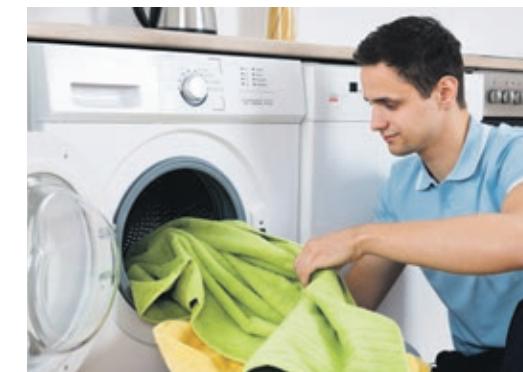
Mit einfachen Tricks die Stromkosten der Waschmaschine spürbar senken.

Wie viele Geräte ziehen täglich Strom, die nicht sofort ins Auge fallen? In Haushalten befinden sich immer mehr Elektronikgeräte, die ungenutzt ne-