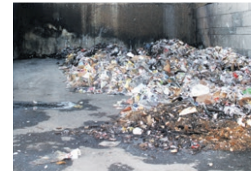
Unerfreulicher Anblick: Schon wieder haben Müllcontainer in Delmenhorst gebrannt.

Anfang des Monats fällt der Startschuss für den Bau des Stauraumkanals in der Friedensstraße. Die App der StadtWerkegruppe, sWapp, soll noch besser werden – daher beginnt Anfang des Monats eine Umfrage. Weniger erfreulich: Das Anzünden von Papiercontainern nimmt kein Ende. Auch in diesem Monat brennen sie wieder.