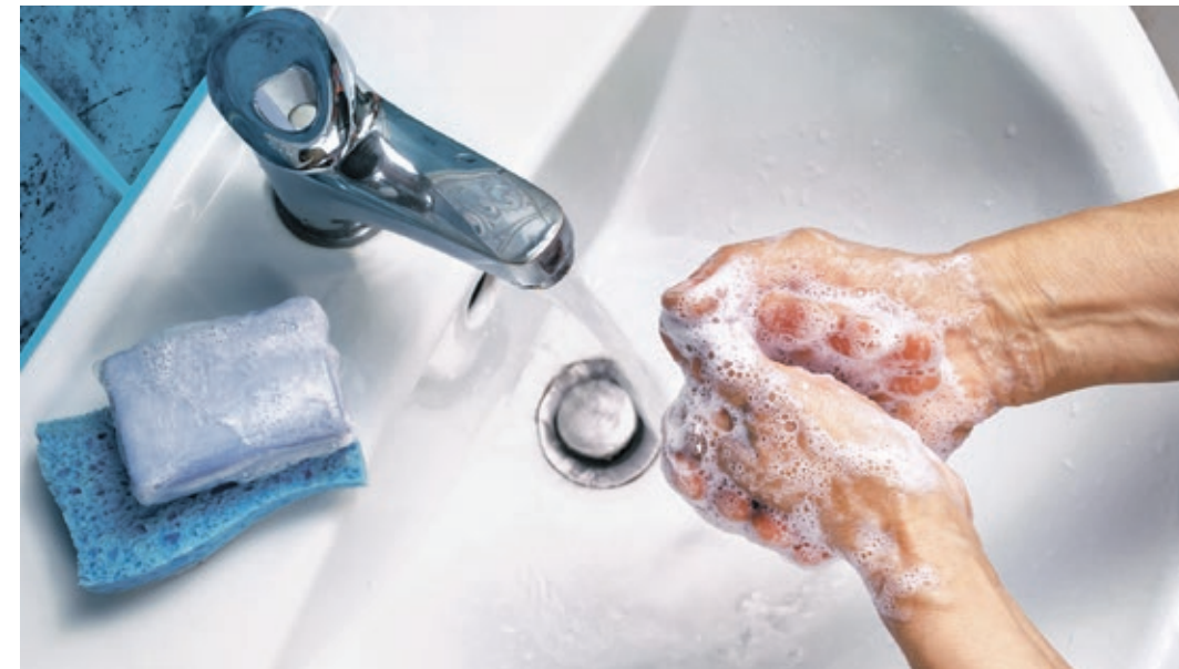
Die Kosten für warmes Wasser stehen an zweiter Stelle beim Energieverbrauch.

Heizung 78 %, warmes Wasser 11 %, Haushaltsgeräte 10 %, Beleuchtung 1 %