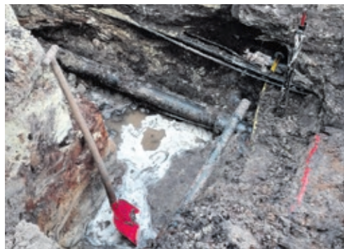
Schnell und effizient: Innerhalb weniger Stunden konnte die Wasserleitung im Wilhelm-Tell-Weg repariert werden.

Gleich am Neujahrstag kommt es zu einem Wasserrohrbruch im Wilhelm-Tell-Weg, bei dem die gesamte Straße unterspült wird. Bereits in den Morgenstunden muss die Leitung komplett gesperrt werden. Dank des schnellen Einsatzes heißt es gegen 11.30 Uhr wieder „Wasser marsch“. Noch bis Ende des Monats gibt es in der GraftTherme die Textilsauna. Danach ist Schluss. Anlass: Viele „Schnupper-Saunierer“ haben in die textilfreie Sauna gewechselt. Die StadtWerkegruppe übergibt derweil die Preise anlässlich der Parkhaus-Entdeckertour im Rahmen der Eröffnung an die Gewinner: Der erste