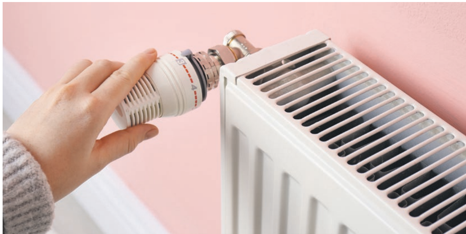
Energiesparen schont nicht nur das Klima, sondern auch die Haushaltskasse.

Etwa 9 Tonnen CO 2 produziert jeder von uns durchschnittlich im Jahr. Dabei kommt der Umweltschutz leichter in die eigenen vier Wände als vielleicht gedacht. Schon kleine Veränderungen im Haushalt lassen die Energiekosten spürbar sinken und schonen somit nicht nur das Klima, sondern auch den Geldbeutel – und das ohne große Komforteinbußen. Es lohnt sich also, genauer hinzuschauen und mit einfachen Spartricks energiebewusster und umweltschonender zu leben. Aber wo lassen sich versteckte Stromfresser aufspüren und damit Energie- sowie Wasserverbrauch reduzieren?