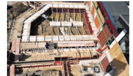
Das neue Kursbecken bietet genügend Platz für weitere Aquafitnesskurse und die Nutzung durch Schulen.

Weniger erfreulich: Schon wieder brennen Papiercontainer. Das zweite Kursbecken in der GraftTherme nimmt Form an, der Bau kommt zügig voran. Für die Mitarbeiter des Delmenhorster Wohlfühlbads steht eine Premiere an, denn sie nehmen mit einem Infostand an der erstmals veranstalteten Freizeitmeile in Bremen teil. Wieder auf Reisen geht das Maskottchen der GraftTherme. Wer das Quietscheentchen in den Urlaub mitnimmt und Fotos postet, kann mit etwas Glück gewinnen.