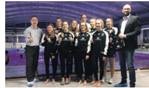
Zweite Bundesliga mit neuer Trainingskleidung: Die GraftTherme stattet die Damen des Delmenhorster Schwimmvereins aus.

im Jahr zuvor. Die GraftTherme unterstützt die in der zweiten Bundesliga startenden Damen des Delmenhorster Schwimmvereins von 1905 bei der Anschaffung von neuer Trainingskleidung. Fortan sind die Schwimmerinnen mit dem Logo der GraftTherme unterwegs.