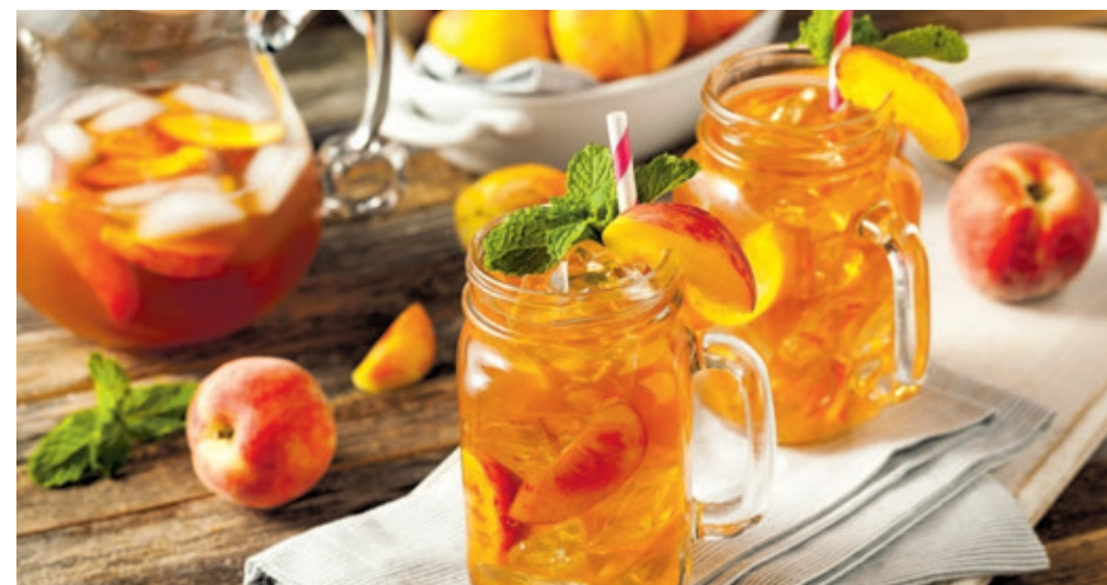
Selbstgemachter Eistee gelingt schon mit einfachsten Mitteln und dient als gesunde Erfrischung.

Wirkung – Zucker erleichtert dem Körper dabei die Aufnahme der Flüssigkeit. Hierzulande gibt es das Phänomen, einen regelrechten Kreislaufkollaps zu erleiden, wenn Menschen ihren Organismus im wahrsten Sinne des Wortes mit eiskalten Flüssigkeiten schocken – denn große Mengen viel zu kalter Getränke überfordern den Kreislauf schlicht und einfach. In südlichen Ländern lässt es sich hingegen oft beobachten, dass Menschen ständig warmen Tee in kleinen Schlucken aufnehmen, wodurch sie ein leichtes Schwitzen in Gang halten und so die Abkühlung des Körpers unterstützen.