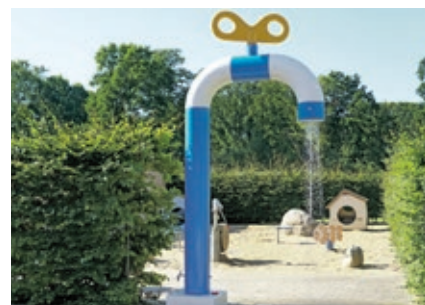
Für eine angenehme Erfrischung sorgt ab sofort eine Dusche im Bereich des Kinderspielplatzes der GraftTherme.

Die GraftTherme hat einen großen bunten „Wasserhahn“ bekommen: Dabei handelt es sich um eine neu installierte Dusche im Bereich des Kinderspielplatzes im Außenbereich. Dort können sich die jungen Gäste nach dem Tollen im Sand erfrischen.