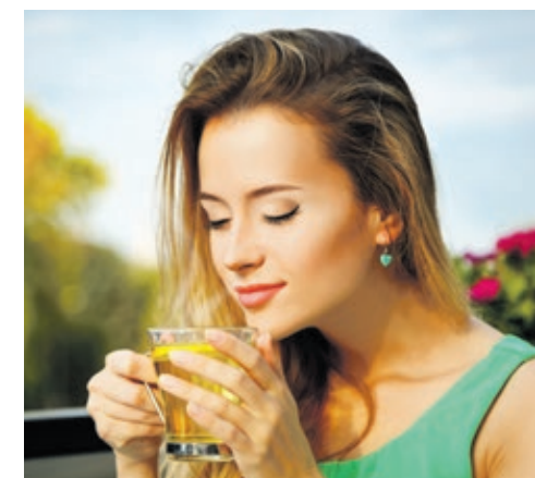
Lecker und beruhigend: Tee besitzt positive Auswirkungen auf den Körper des Menschen.

15 g Früchtetee (z. B. Mischungen mit Marillen-, Ananas- oder Mangogeschmack oder -stücken) mit einem 3/4 Liter 100 °C heißem Wasser aufgießen, 5 bis 8 Minuten ziehen lassen und über reichlich Eiswürfel gießen. Mit ein wenig Fruchtsaft (zum Beispiel Ananas- oder Pflirsichsaft), Cranberry-Sirup oder Früchten mischen.