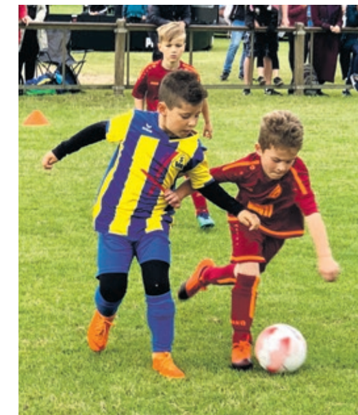
Beim Charity-Cup gab es packende Duelle unter dem Motto „Kinder spielen für Kinder – gegen Noma-Parmed“.