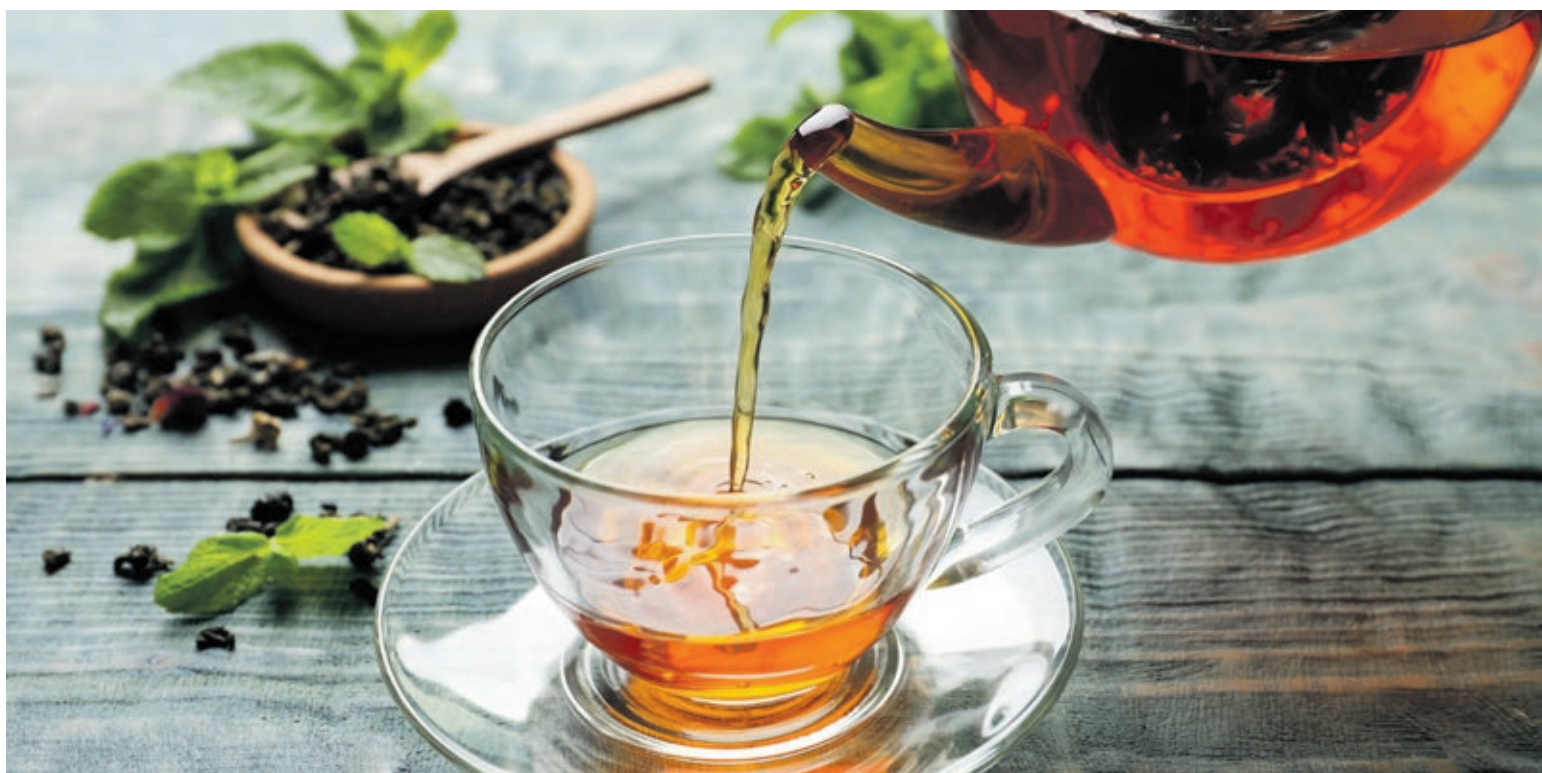
Traditionelle Teesorten wie schwarzer, grüner oder weißer Tee stellen schon lange neben Kaffee die bevorzugten Genussmittel der Menschheit dar.

Heiße Temperaturen bringen fast jeden ins Schwitzen. Da wünschen sich viele nichts sehnlicher, als eine eisgekühlte Erfrischung zu sich zu nehmen. Egal, ob Limonade mit Eiswürfeln oder Mineralwasser – Hauptsache kalt. Doch genau hier verbirgt sich ein großer Irrtum: Kalte Getränke bei Hitze zu trinken, sorgt nur temporär für eine Kühlung des Körpers – langfristig schwitzt er dadurch noch mehr. Nur die wenigsten Menschen kommen deshalb bei Temperaturen von über 30 °C auf den Gedanken, Tee zu genießen. In anderen Kulturen und Ländern der Welt gehört es hingegen zum Alltag, auch in der warmen Jahreszeit Tee zu trinken.