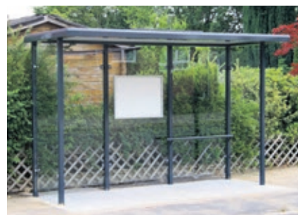
Schutz vor Wind und Wetter: Ein neues Bushäuschen an der Haltestelle Rubensstraße sorgt für glückliche Fahrgäste.

Die Haltestelle Rubensstraße in der Brauenkamper Straße hat auf Wunsch vieler ÖPNV-Fahrgäste ein neues Buswartehäuschen bekommen. Dank einer Steh-/Sitzhilfe ist das Wartehäuschen mobilitätsgerecht, ab sofort bietet es Schutz bei schlechtem Wetter. Das Buswartehäuschen wird mit Mitteln des Landes Niedersachsen und des Zweckverbandes Verkehrsverbund Bremen/Niedersachsen gefördert.