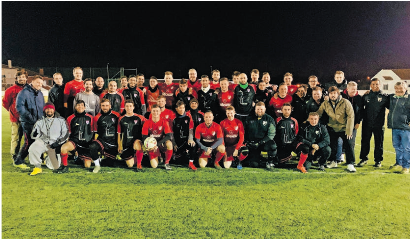
Gruppenfoto auf Portugiesisch: Während eines Trainingslagers im Januar lernten die Fußballer der ersten Herren den sympathischen Club Grupo Desportivo Pontével kennen.