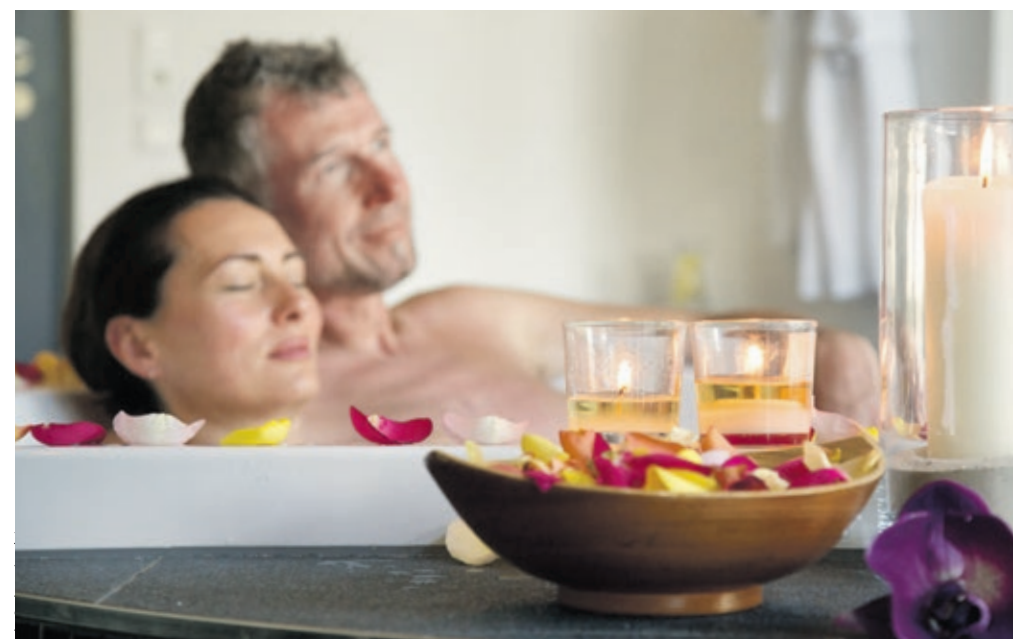
Kleine Auszeiten im Alltag liefern neue Energie und gelingen schon mit einfachen Mitteln.

Schon seit Jahren liegt Wellness absolut im Trend, ein Abklingen dieses Booms ist dabei nicht in Sicht. Doch Erholung gilt nicht nur als moderne Gewohnheit, die sich in fast allen Lebensbereichen widerspiegelt: Da der Stress im Alltag zunimmt, gewinnen kleine Pausen immer mehr an Bedeutung. Ob im eignen Heim, Urlaub oder Spa – Auszeiten vom Alltag lassen sich fast immer zwischendurch einbauen.