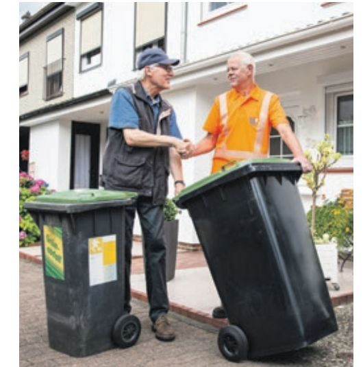
Kundenkontakt ist den Mitarbeitern der StadtWerkegruppe wichtig: Man nimmt sich die Zeit für ein Gespräch mit Kunden.

„Zusammen mit meinen Kollegen Sorge ich für den Um- und Neubau, die Wartung und Reparatur der Straßenbeleuchtung sowie Ampelanlagen. Außerdem bin ich für die Organisation