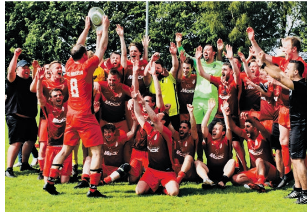
Mit Schale in der Hand und einem Lächeln im Gesicht durfte Ende Mai die Kreisliga-Meisterschaft gefeiert werden.

Direkt im Januar läutete der TuS Heidkrug sein Jubiläumsjahr mit einer spektakulären Turnshow ein. In der Halle der Integrierten Gesamtschule Delmen-